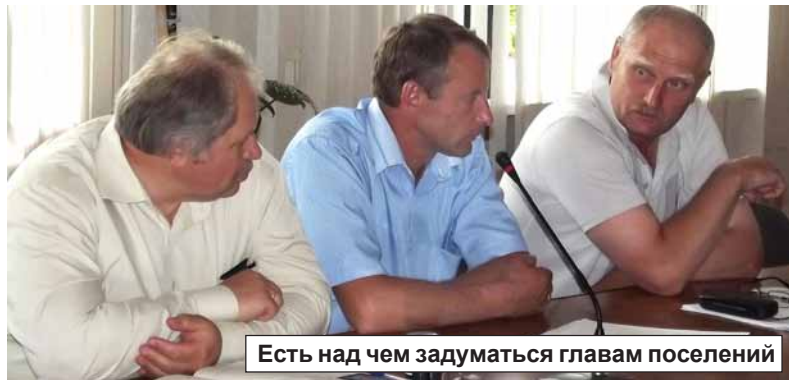
Есть над чем задуматься главам поселений

Игорь Викторович порекомендовал главам Мушковичского, Петровского и Зайцевского сельских поселений обратиться особое внимание на работу своих ОПС; возможно, снизить арендную плату, помочь сделать ремонт, выделить помещения. Но не все главы с этим