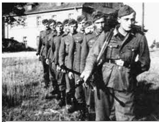
Немецкая разведка хотела сделать из наших ребят вот таких агентов абвера. Но план провалился!

Кому-то из руководства Смоленского отдела абвера пришла мысль использовать в качестве рядовых агентов этих оставшихся наших подростков, послав их через линию фронта с определенными заданиями с разных участков неустоявшегося фронта и с возвращением с собранными разведданными в опре-